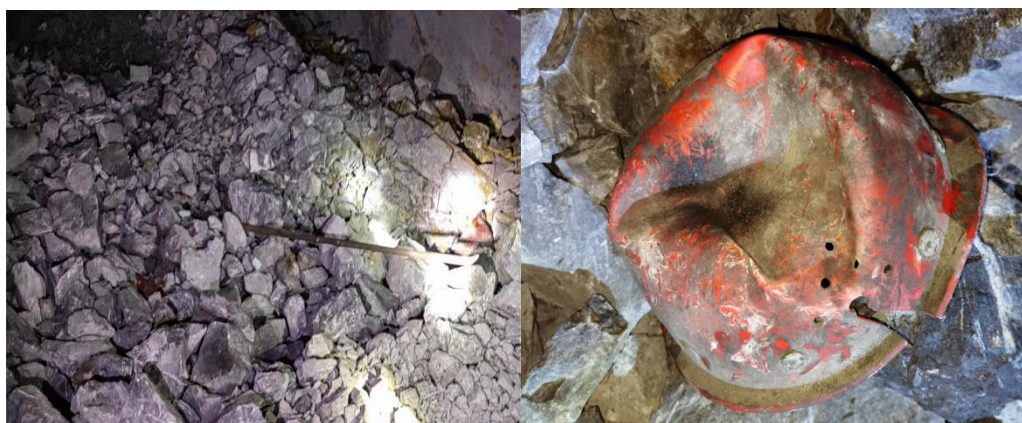
图 3 事故现场照片（撬棍、安全帽）