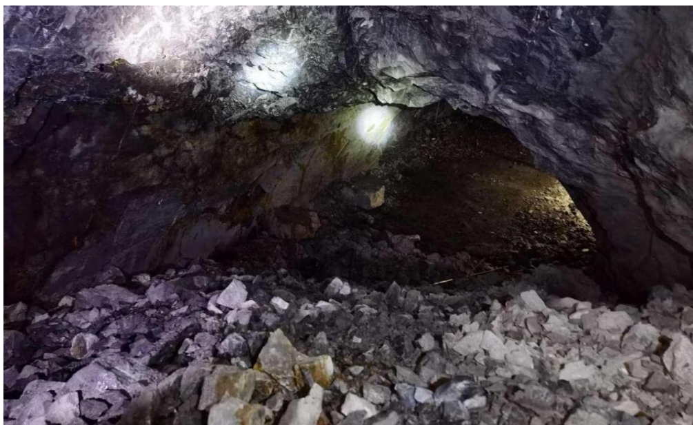
图 2 事故现场照片（自上而下视角）